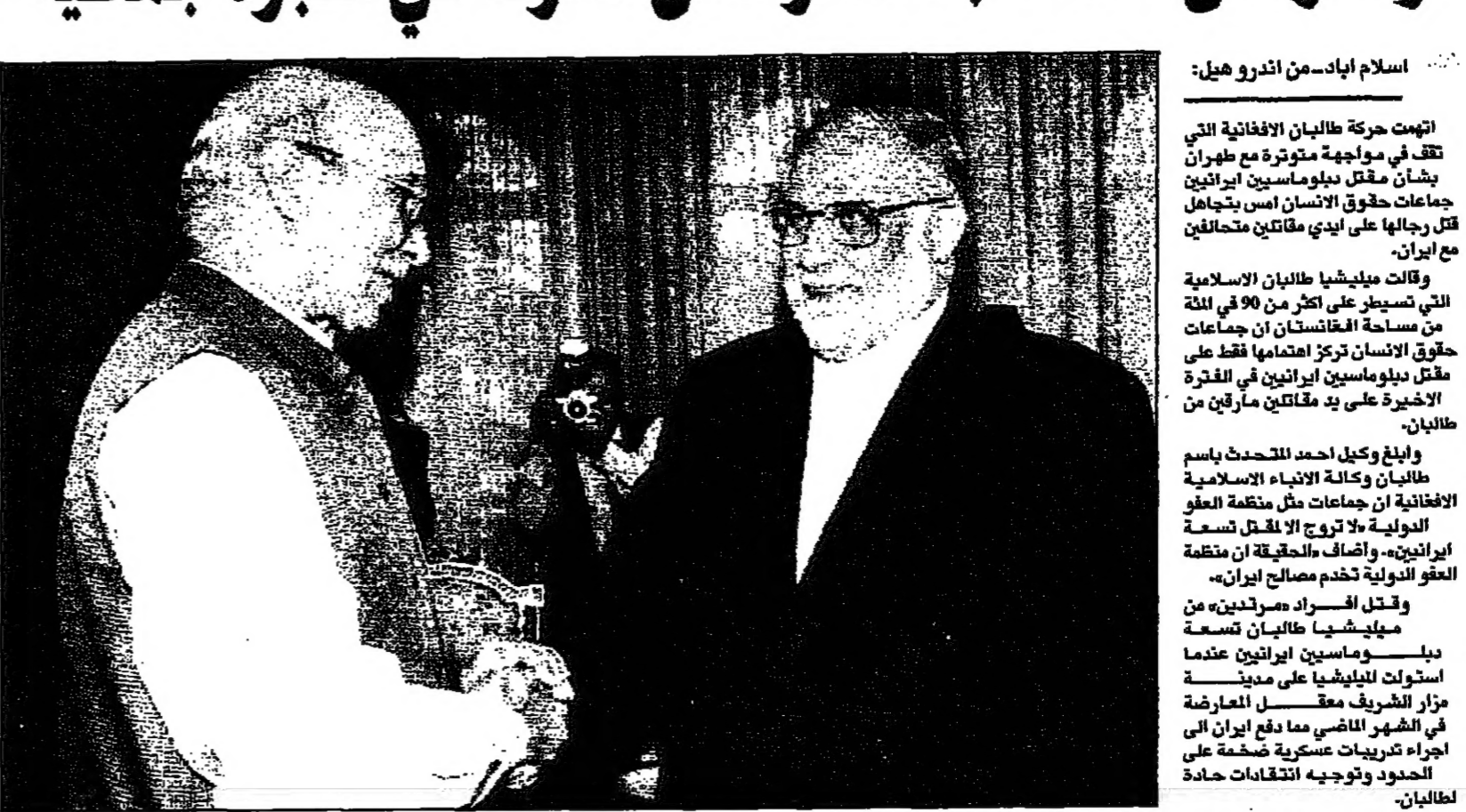
وزير الخارجية الباكستاني سراج عزيز يصباح نائب الرئيس الإيراني حسن مجتبي في طهران في إطار زيارة التفهيم حدة التوتر بين إيران وباكستان